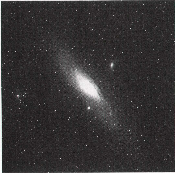
図1 可視光 (Vバンド) で見たアンドロメダ銀河 M31の全景。