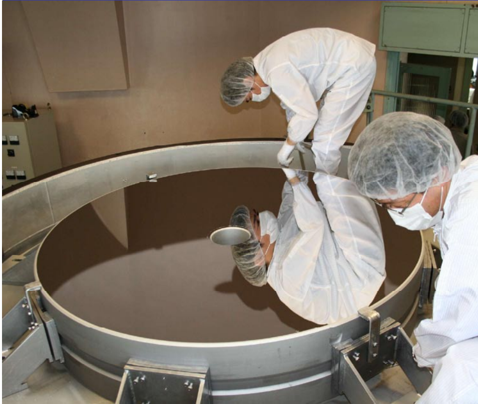
アルミ蒸着後の主鏡(岡山観測所)