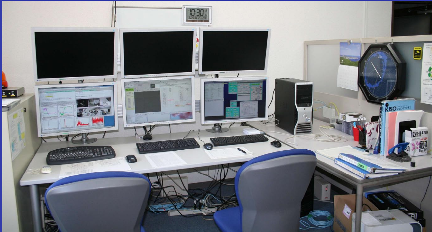
観測室ディスプレイ群(上段:ステータス表示用、下段:制御用)