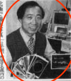
木曾星の会会長(畑)

星見の達人木曾星の会は、国内最大級の星見の地、東京大学の天文観測所もある。星見がはとんなく、星見の達人木曾星の会は、国内最大級の星見の地、東京大学の天文観測所もある。